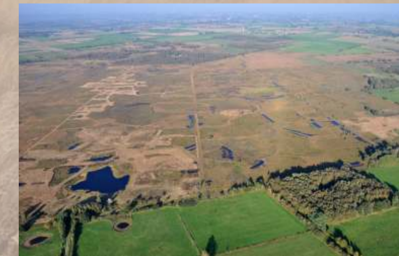
Zentralbereich des Oppenweher Moores

Das Oppenweher Moor wird durch die Landesgrenze zwischen Nordrhein-Westfalen (Kreis Minden-Lübbecke) und Niedersachsen (Landkreis Diepholz) politisch geteilt. Vögel und Pflanzen nehmen diese Grenze nicht wahr. Im Sinne des Europäischen Schutzgebietssystems NATURA 2000 arbeiten Nordrhein-Westfalen und Niedersachsen gemeinsam an der grenzübergreifenden Gebietsentwicklung.