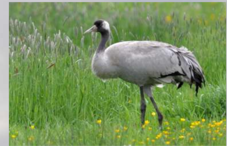
Kraniche können häufig im Umfeld der Moore beobachtet werden

Das Vogelschutz- und FFH-Gebiet 'Oppenweher Moor' weist eine beeindruckende Anzahl landesweit gefährdeter Vogelarten auf. Bekassinen haben hier den landesweit höchsten Brutbestand. Hervorzuheben sind auch die Brutvorkommen von Krickente, Raubwürger und Schwarzkehlchen. In den letzten Jahren hat sich das Gebiet zu einem bedeutenden Rastplatz für den Kranich entwickelt. Große Kranichtrupps ziehen regelmäßig im November über das Moor, ihr trompetenhafter Schrei ist unüberhörbar. Zum Höhepunkt der Rast können sich über 40.000 Kraniche in der Diepholzer Moorniederung aufhalten.