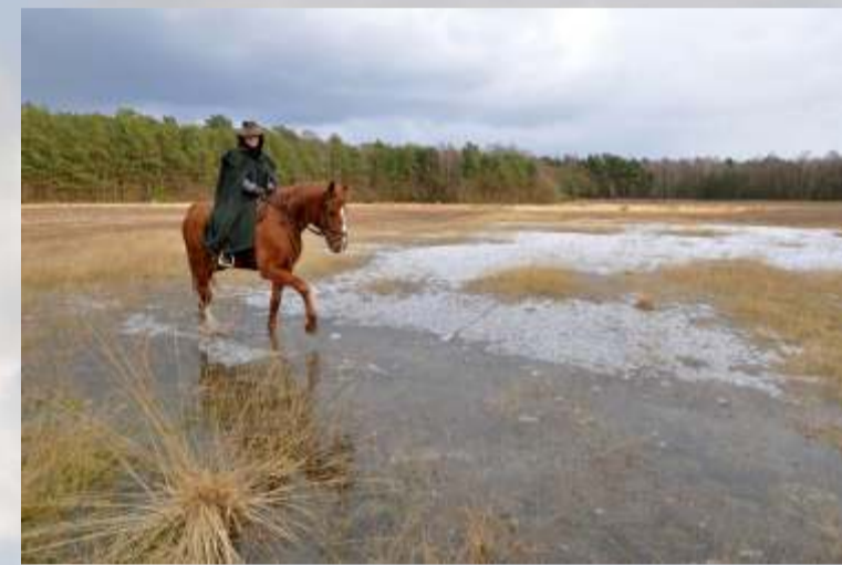
Wie mag die Frau den Weg durchs Oppenweher Moor gefunden haben?