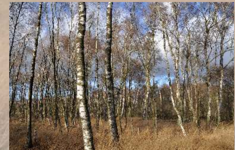
Lichter Moorbirkenwald prägt die trockeneren Randbereiche des Moores