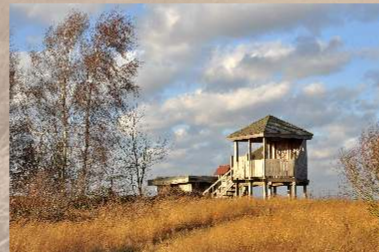
Vogelbeobachtungsstand am Südrand des Moores

Rundweg V: Ein 2,4 km Rundweg führt im trockeneren Randbereich des Moores durch offenes Grünland und kleine Moorbirkenwäldchen.