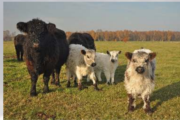
Extensive Beweidung der Feuchtwiesen mit Galloways

Der östliche Teil des Naturparks wird geprägt durch weite Moorlandschaften. Die renaturierten Moore der Diepholzer Moorniederung haben für den internationalen Naturschutz eine besondere Bedeutung. Vor allem zur herblichen Kranichrast lockt die Niederung zahlreiche Vogelbeobachter aus dem In- und Ausland an. Der Vogelzug dieser beeindruckenden Großvögel zwischen Brut- und Überwinterungsgebiet ist hier hautnah erlebbar.