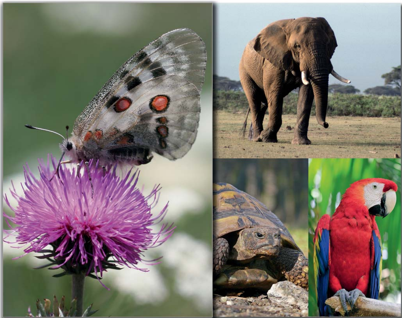
Abb. 1: CITES-„Kunden“: Apollo-Falter, die leichteste Art; Afrikanischer Elefant, die schwerste Art; Griechische Landschildkröte: in den letzten Jahren die häufigste Art; Hellroter Ara, die farbenfroheste Art

Die CITES-Bescheinigungen für Tiere und Pflanzen können in ihrer Funktion mit einem Personalausweis verglichen werden. Sie bestätigen die rechtmäßige Einfuhr in die EU oder die rechtmäßige Nachzucht innerhalb der EU für ein ganz konkretes, durch Lichtbild, Fußring oder sonstige Markierung bezeichnetes Individuum. Sie sind Voraussetzung für jeden legalen Handel mit den betreffenden Tieren und Pflanzen innerhalb der EU bzw. für die Ausfuhr aus der EU.