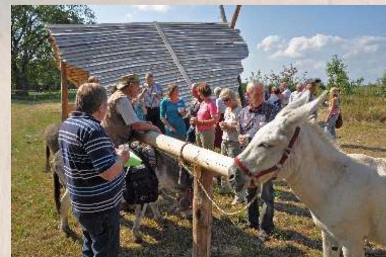
Rast am Grillplatz "Auf den Bröken" vor dem Steweder Berg