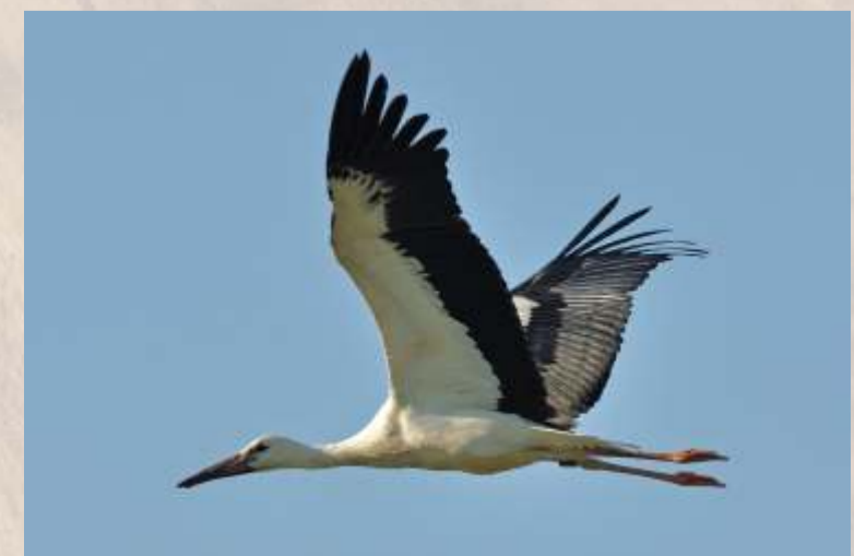
Der junge Weißstorch freut sich über feuchte Wiesen am Dümmer