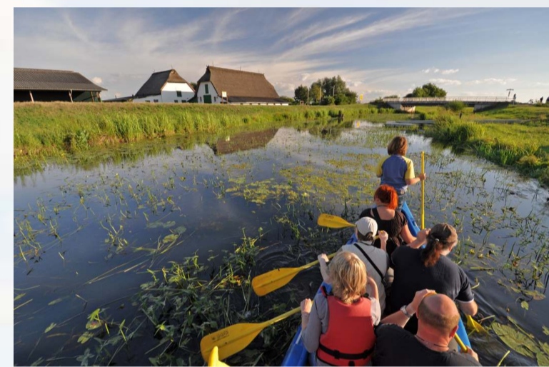
Mit dem Kanu auf dem Weg zum Schäferhof

Der östliche Teil des Naturparks wird geprägt durch weite Moorlandschaften. Die renaturierten Moore der Diepholzer Moorniederung haben für den internationalen Naturschutz eine besondere Bedeutung. Vor allem zur herbstlichen Kranichrast lockt die Niederung zahlreiche Vogelbeobachter aus dem In- und Ausland an. Der Vogelzug dieser beeindruckenden Großvögel zwischen Brut- und Überwinterungsgebiet ist hier hautnah erlebbar.