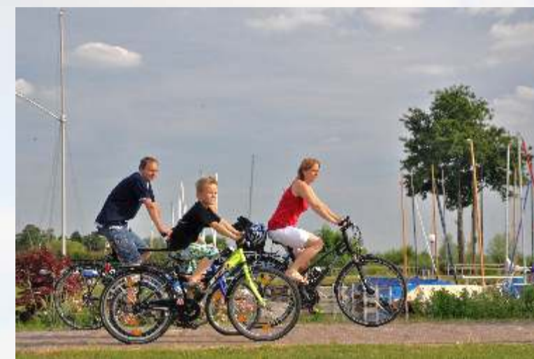
Das dichte Radwegenetz fördert den naturverträglichen Tourismus

Wer es noch etwas spektakulärer haben möchte, der besucht im Oktober und November einen der Aussichtstürme in Rehdeger Geestmoor, Neustädter Moor, Oppenweher Moor oder das Große Moor bei Barnstorf. Dort können in den späten Nachmittagsstunden große Kranichtrupps beobachtet werden, die von den Nahrungsflächen zurück in die vernässen