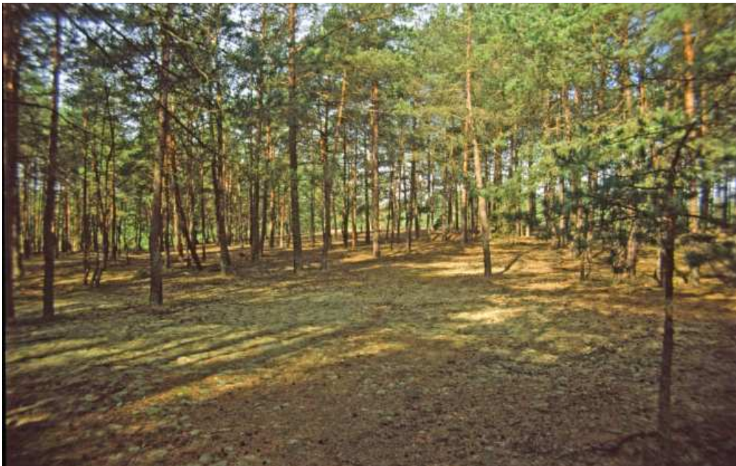
Abb. 4: Schlechtwüchsiger Flechten-Kiefernwald 1991 mit Grenz-waldcharakter bei Cacherien auf der „Langendorfer Geestinsel“