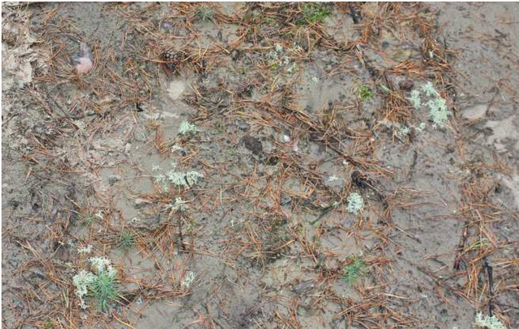
Abb. 24: Mit Cladonia portentosa beimpfte Plaggfläche „Carrenziener Forst“

Für die in den Jahren 2020 und 2021 behandelten Flächen ergaben sich dabei folgende Kosten pro Hektar: gezielte Beimpfung mit „seltenen“ Flechtenarten, 19 Stunden, ca. 960 €/ha und die Beimpfung mit „häufigen“ Arten, 16 Stunden, 764 €/ha. Die Gesamtmaßnahme kostete damit in der günstigsten Variante ohne Materialabfuhr rd. 3.000 €/ha, mit Abfuhr rd. 29.000 €/ha. Andere Pflegemaßnahmen sind zunächst nicht vorgesehen. Auf den freigelegten Sandböden keimende Kiefern werden toleriert.