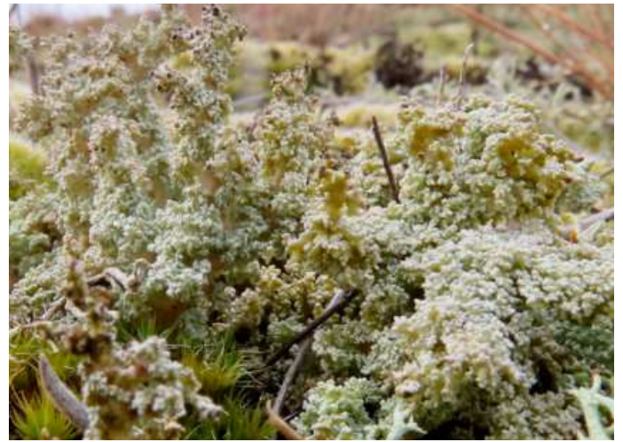
Abb. 15: Cladonia foliacea (links) und Stereocaulon taeniarum (rechts) im „Carrenziener Forst“, zwei selten im Flechten-Kiefernwald auftretende Arten mit Vorkommen auch im Offenland. Stereocaulon taeniarum ist ein Neufund für Deutschland.

Lediglich jeweils in einem LRT-Bestand des „Carrenziener Forstes“ konnten die bundesweit stark gefährdeten Arten Cetraria islandica und Cladonia stygia (s. BÜLTMANN et al. 2021, Abb. 16) gefunden werden. Die Rentierflechte Cl. stygia , die seit 2012 an vier Stellen im Flechten-Kiefernwald des Naturwaldes „Kaarßer Sandberge“ nachgewiesen wurde, war für Niedersachsen ein Wiederfund. Auch für Cladonia polydactyla und Cl. scabriuscula sowie die Krustenflechten Micarea viridileprosa , Micarea leprosula , Placynthiella oligotropa , Placynthiella uliginosa und Trapeliopsis granulosa , die als Begleitarten und/oder Totholzarten eingestuft wurden, erfolgte innerhalb des Datensatzes 2017/18 (n = 59, Kap. 4.1) nur ein Nachweis in je einer Untersuchungsfläche.