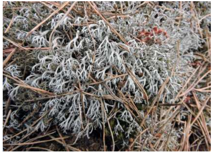
Abb. 12: Cladonia squamosa s. l. (links) und Cl. rangiferina (rechts) im „Carrenziener Forst“, zwei (stark gefährdete bzw. vom Aussterben bedrohte) Flechtenarten in Niedersachsen, die nur in flechtenartenreichen (Durchschnitt 13,7 bzw. 12,6 Flechtenarten) und größeren (mindestens 913 m 2 bzw. 2.121 m 2 ) Flächen vorkommen.

Die gabelig verzweigte elfenbeinfarbene Cladonia zopfii (Abb. 14) konnte vor allem auf dem Dünenzug „Carrenziener Forst“ und in den Geestgebieten mit Flugsand gefunden werden (s. Tab. 2). Die von KRIEGER (1937) als Lichtart eingestufte Cl. zopfii kommt nur in Beständen mit mindestens neun Flechtenarten und überwiegend in Beständen mit Offenland- oder Wegrand vor (s. a. BÜLTMANN et al. 2011). Die mit rot gefärbten Fruchtkörpern charakterisierten Cladonia coccifera s. l. (Abb. 14) und Cl. macilenta ssp. macilenta sowie Cl. furcata s. l. (s. a. KRIEGER 1937) treten darüber hinaus auch gerne in lichten LRT-Beständen (Abb. 13) und wie Cl. glauca in kleinen, aber insgesamt meist artenreicheren Flächen (im Mittel ca. 14 Flechtenarten) auf.