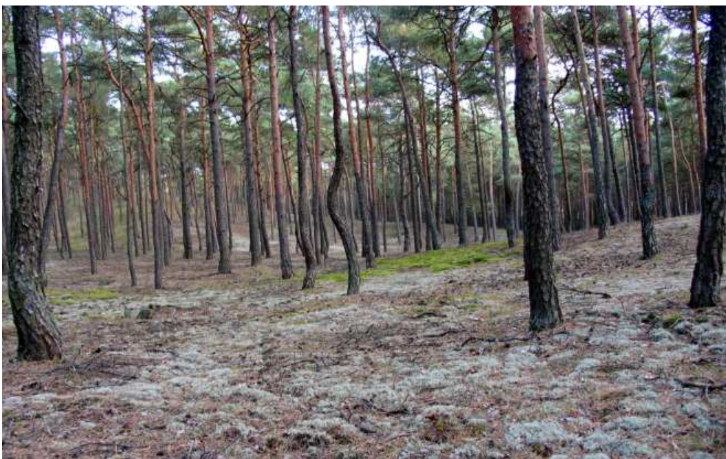
Abb. 5: Ein noch relativ großflächiger Flechten-Kiefernwald im „Carrenziener Forst“ im Jahr 2005, der inzwischen stark zurückgegangen ist.