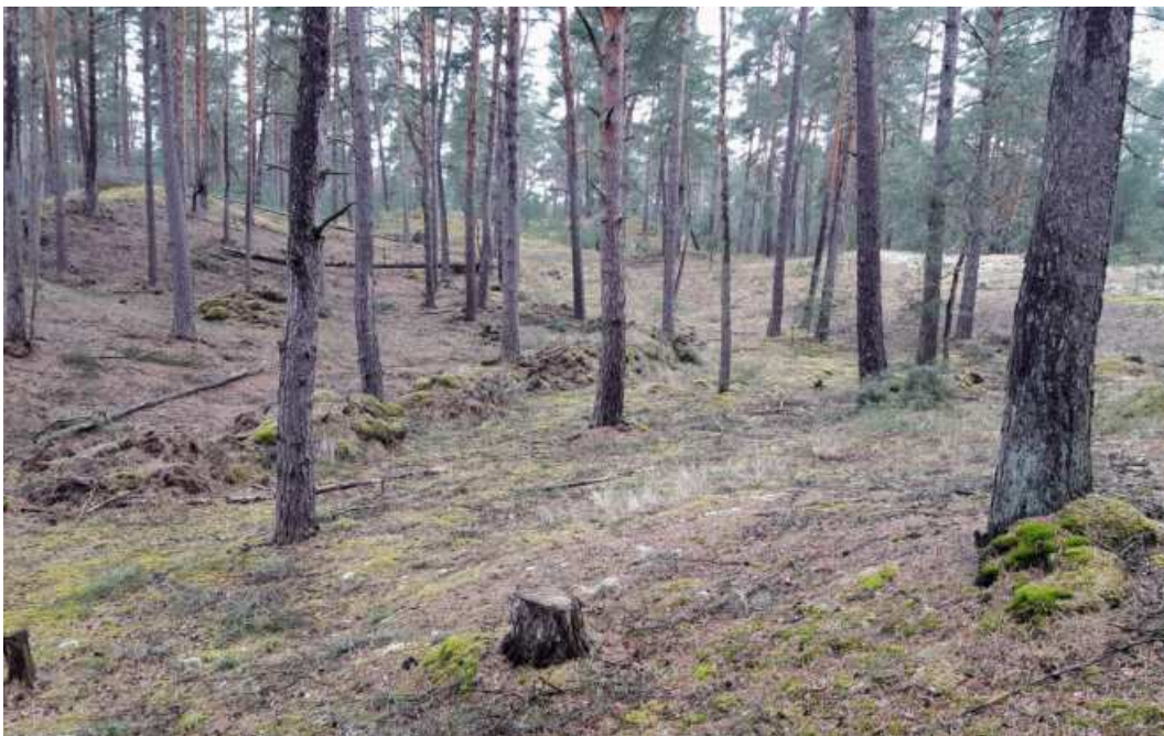
Abb. 25: Maßnahmenfläche im „Carrenziener Forst bei Pinnau“ links oben Plaggfläche 2019, rechte Bildhälfte Plaggfläche aus dem Jahre 2015 mit erkennbarem Flechten-Bewuchs nach Beimpfung