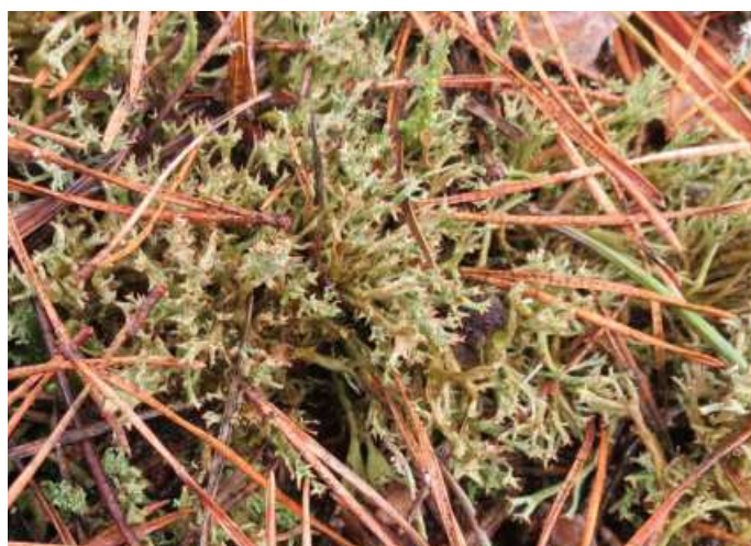
Abb. 9: Cladonia pyxidata s. l. (links) und Cl. crispata s. l. (rechts) in Flechten-Kiefernwäldern des „Carrenziener Forstes“