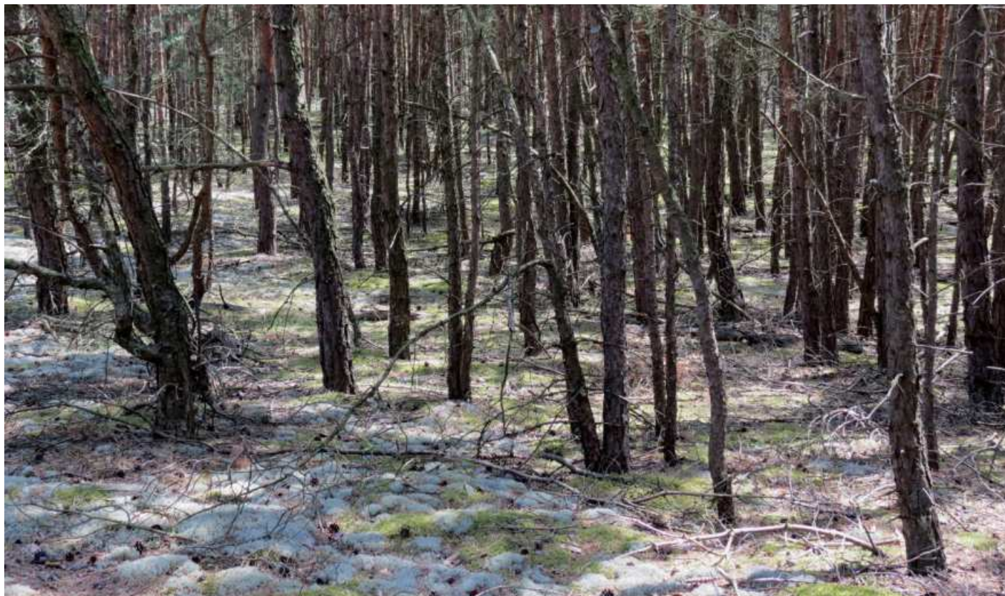
Abb. 8: Stangenholz-Bestand bei Cacherien („Langendorfer Geest“), in dem Arten wie Cladonia pyxidata s. l. und Cl. crispata s. l. auftreten, aber die Rentierflechte Cl. ciliata s. l. fehlt (s. u.).

kontinental geprägten Gebieten „Langendorfer Geest“ und „Höhbeck“ in allen Beständen vertreten (Tab. 2). Cl. crispata s. l. und die Becherflechte Cl. pyxidata s. l. fehlen jedoch in (fast) der Hälfte der LRT-Bestände der „Wälder bei Küsten“ (Tab. 2). Cl. pyxidata s. l. fällt v. a. in kleineren, besonders artenarmen (mit 3-4 Arten) Beständen aus, kann dann aber am Stammfuß oder auf Totholz und Zapfen vorkommen.