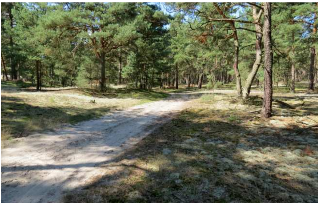
Abb. 13: Lichter, windbeeinflusst, von einem Sandweg durchschnittener, artenreicher Flechten-Kiefernwald auf flachwelligen Dünen- und Flugsandablagerungen am Geesthang des Hühbeckes. Hier treten u. a. Cladonia zopfii, Cl. coccifera s. l., Cl. macilenta ssp. macilenta und Cl. foliacea auf.