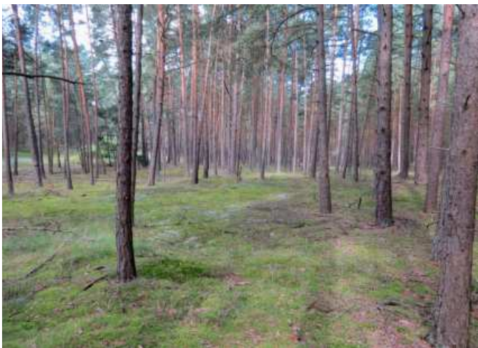
Abb. 17: Aufgrund der noch flachen Moospolster, des geringen Drahtschmielen-Anteiles und der restlichen Flechten (Deckung < 5 %) geeignete Entwicklungsfläche zum LRT 91T0 bei Maßnahmen (Abplaggen und Beimpfung mit Flechten) auf der „Langendorfer Geest“ nahe der „Wüste Gobi“