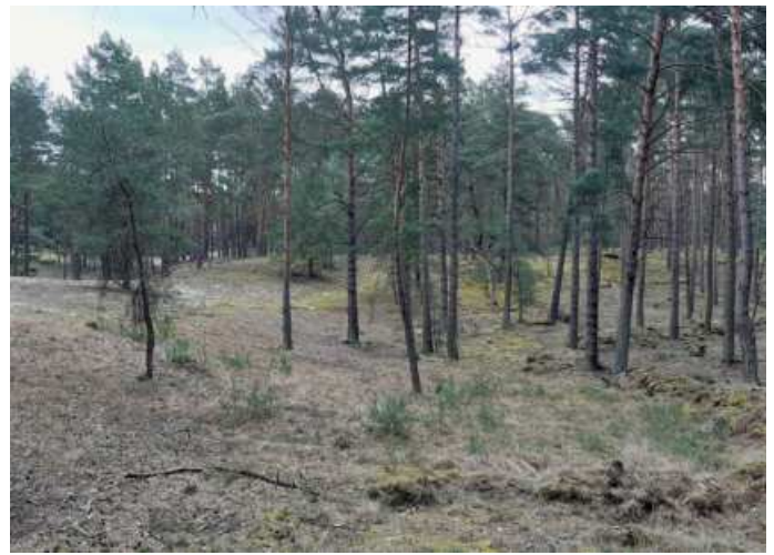
Abb. 23. Maßnahmenfläche bei Pinnau nach Materialabfuhr im November 2015 und im März 2022