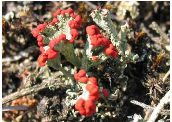
Abb. 14: Cladonia zopfii (links) und Cl. coccifera s. l. (rechts) im „Carrenziener Forst“, zwei Arten, die bevorzugt in ans Offenland angrenzende Flechten-Kiefernwäldern vorkommen.