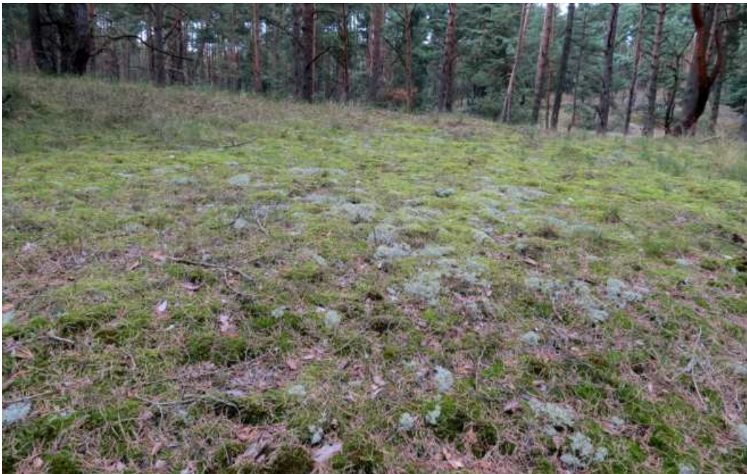
Abb. 18: Punktueller Flechtenvorkommen im „Carrenziener Forst“ mit 150 m 2 Größe, u. a. mit Cladonia portentosa