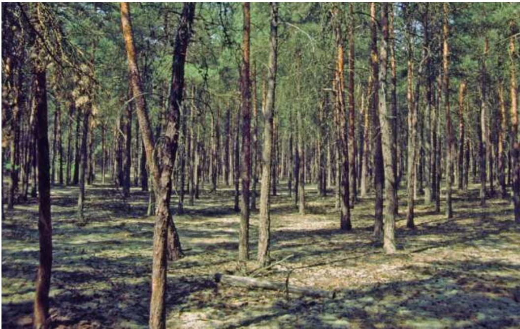
Abb. 6: Ausgehend von 1991, ein noch vor gut 30 Jahren streugenuzter Flechten-Kiefernwald in den „Wäldern bei Küsten“, in dem Moos und Nadeln zusammengereicht wurden.