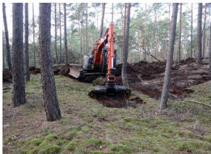
Abb. 21: Ein Bagger zieht die Moos- und Rohhumusaufgabe ab.

ten im Rahmen von Kompensationsmaßnahmen (Ausgleichsmaßnahmen für Überbauung von Magerrasen und trockenem Kiefernwald im Zuge eines Radwegebaus) in Zusammenarbeit mit der Straßenbauverwaltung Lüneburg und der Biosphärenreservatsverwaltung Niedersächsische Elbtalaue erste größere Flächen – insgesamt rd. 2 ha in 7 Teilflächen – maschinell abgeplaggt werden. Zum Einsatz kamen ein Raupenbagger mit schwenkbarem Grabenlöffel bzw. Räumrechen (Abb. 21) sowie ein Radlader bzw. ein Kleinbagger. Vorbereitend wurden die zu bearbeitenden Flächen sowie die Fahrgassen für Bagger und Traktoren im Gelände deutlich markiert. Restvorkommen von Flechten, Ameisenhaufen und andere Besonderheiten durften nicht beeinträchtigt werden, die Stammbereiche der Kiefern waren zu schonen.