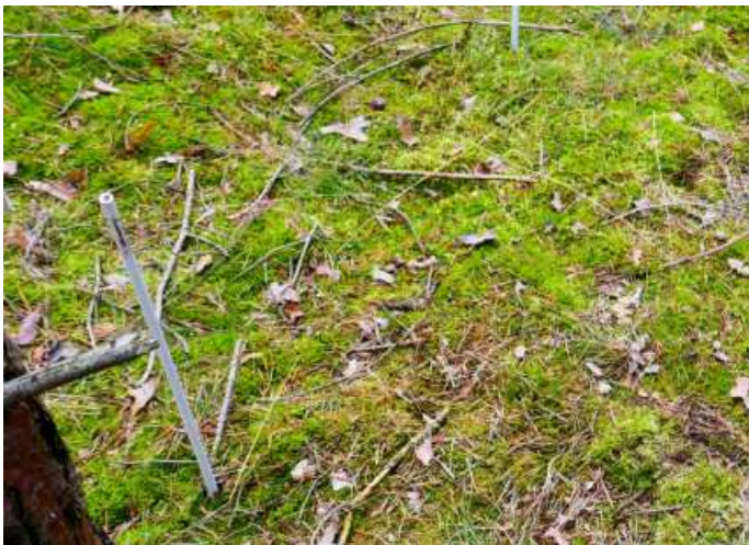
Abb. 19: Dauerbeobachtungsfläche im Naturwald „Kaarßer Sandberge“ („Carrenziener Forst“), oben 2005, Mitte 2012 und unten 2020, in der u. a. Cladonia crispata s. l. ausgefallen und sogar Cl. portentosa nahezu ausgefallen ist.