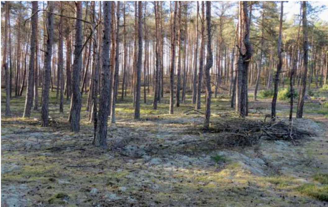
Abb. 3: In einer Ausblasungsmulde liegender Flechten-Kiefernwald in der „Wäldern von Küsten“