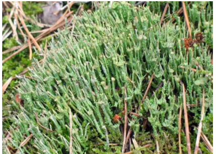
Abb.7: Zwei häufige Rentierflechten des Flechten-Kiefernwaldes: Cladonia portentosa (oben) und Cl. arbuscula s. l. (unten links) und die häufige Strauchflechte Cl. gracilis (unten rechts)