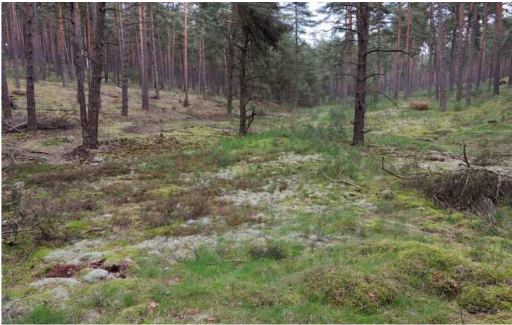
Abb. 2: Fragmentierte Restbestände des Flechten-Kiefernwaldes im Endmoränengebiet „Wierener Berge“