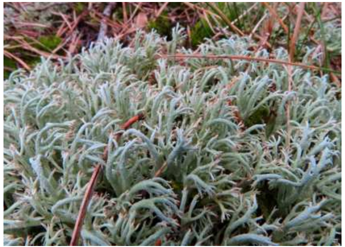
Abb. 16: Cetraria islandica (links) und Cladonia stygia (rechts) im „Carrenziener Forst“, zwei selten im Flechten-Kiefernwald auftretende Arten mit Vorkommen auch im Offenland