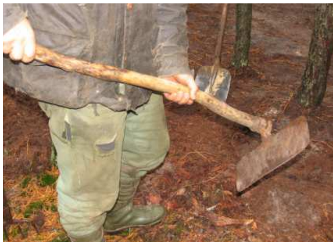
Abb. 20: Manuelles Abplaggen im Rahmen der Streunutzungsversuche im „Carrenziener Forst“