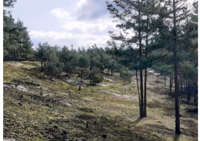
Abb. 26: Freigestellte Düne im Kiefernwald des „Carrenziener Forstes“ bei Zeetze, links am 15.06.2012 und rechts am 05.04.2022 mit deutlicher Zunahme von Campylopus introflexus (Kaktusmoos)