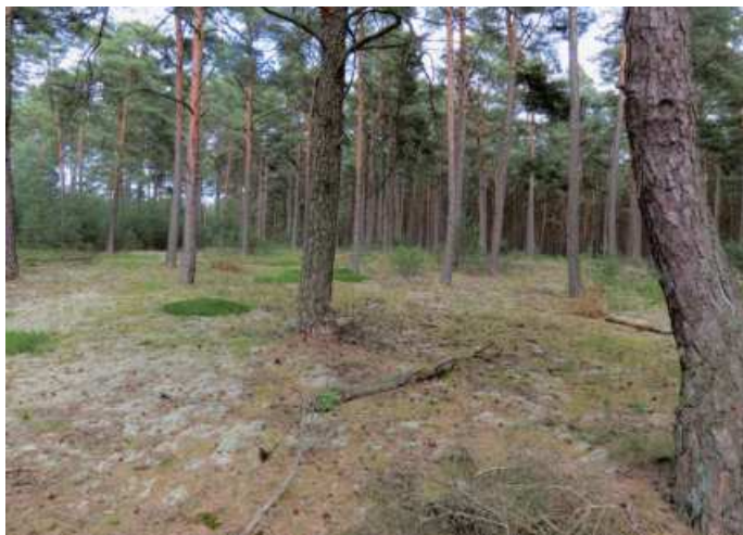
Abb. 10: Altholz-Bestand auf dem Mühlenberg der „Langendorfer Geest“ u. a. mit der Rentierflechte Cladonia ciliata s. l. und der Becherflechte Cl. ramulosa

Noch mit einem prozentualen Anteil von 25-50 %, aber teils nicht mehr in allen Teilgebieten (Tab. 1, Tab. 2) und meist in der Mengenkategorie 1 treten Cladonia squamosa s. l., Cl. coccifera s. l., Cl. glauca , Cl. furcata s. l., Cl. macilenta ssp. macilenta , Cl. rangiferina und Cl. zopfii im LRT 91T0 auf. Die durch vollständig beschuppte Podetien gekennzeichnete Cl. squamosa s. l. und die vom Aussterben bedrohte Rentierflechte Cl. rangiferina (Abb. 12) fehlen i. d. R. in kleinen artenarmen Flechten-Kiefernwaldflächen.