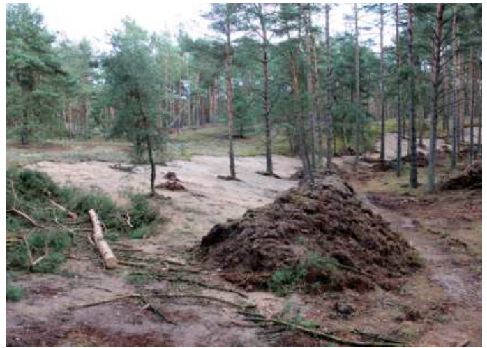
Abb. 22. Maßnahmenfläche bei Pinnau vor und unmittelbar nach dem Plaggen im November 2015