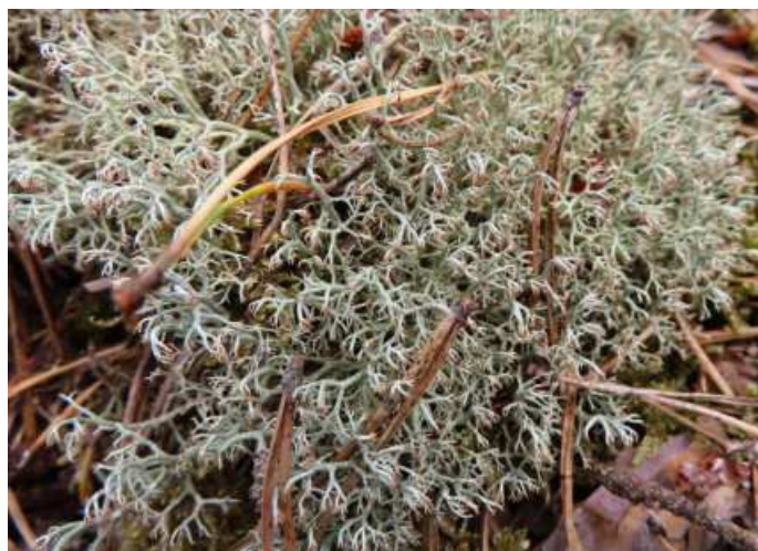
Abb. 11: Cladonia phyllophora (oben), Cl. cervicornis ssp. verticillata (Mitte) und Cl. ciliata s. l. (unten) in Flechten-Kiefernwäldern des „Carrenziener Forstes“

Noch mit einem prozentualen Anteil von 25-50 %, aber teils nicht mehr in allen Teilgebieten (Tab. 1, Tab. 2) und meist in der Mengenkategorie 1 treten Cladonia squamosa s. l., Cl. coccifera s. l., Cl. glauca , Cl. furcata s. l., Cl. macilenta ssp. macilenta , Cl. rangiferina und Cl. zopfii im LRT 91T0 auf. Die durch vollständig beschuppte Podetien gekennzeichnete Cl. squamosa s. l. und die vom Aussterben bedrohte Rentierflechte Cl. rangiferina (Abb. 12) fehlen i. d. R. in kleinen artenarmen Flechten-Kiefernwaldflächen.