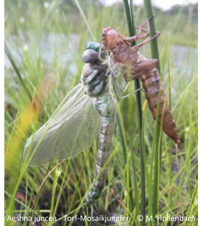
Aeshna juncea - Torf-Mosaikjungfer