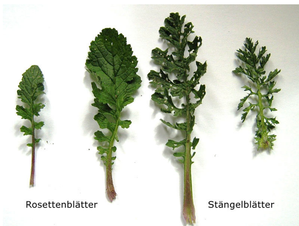
Abbildung 4 Rosettenblätter und Stängelblätter im Vergleich Abb. LWK Nordrhein-Westfalen

Am Boden bildet die Pflanze vor dem Höhenwachstum Rosetten und ist damit für das geübte Auge schon in diesem Stadium zu erkennen. Rosettenblätter sind am Stängelansatz fiederteilig, während die Stängelblätter durchgehend fiederteilig sind.