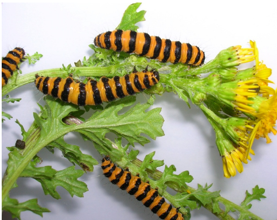
Abbildung 5 Raupen des Jakobskrautbären am Jakobs-Greiskraut

Daneben gibt es als Gegenspieler auch spezialisierte Blattrandkäfer oder Saatfliegen. Auch Rostpilze sind in der Lage, die Pflanze zu schädigen. Diese Antagonisten werden unter dem Aspekt der biologischen Bekämpfung diskutiert. Praxisreife biologische Verfahren sind aber noch nicht in Sicht.