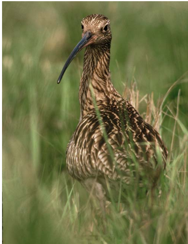
Abb. 1: Großer Brachvogel