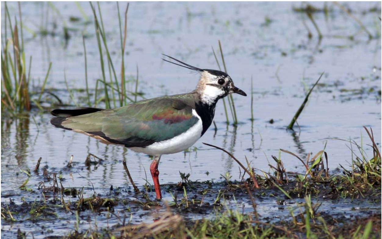
Abb. 1: Kiebitz