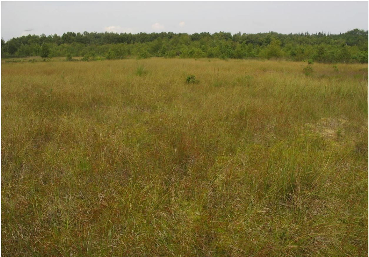
Abb. 1: Übergangsmoor mit torfmoosreichen Wollgras- und Fadenseggen-Rieden (NSG Ochsenweide, Schafhauser Wald und Feuchtwiesen bei Esens)