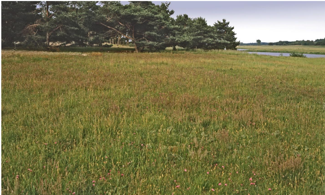
Abb. 1: Basenreicher Sandtrockenrasen, u. a. mit Zierlichem und Blaugrünem Schillergras sowie Kartäuser-Nelke; Wendland am Laascher See