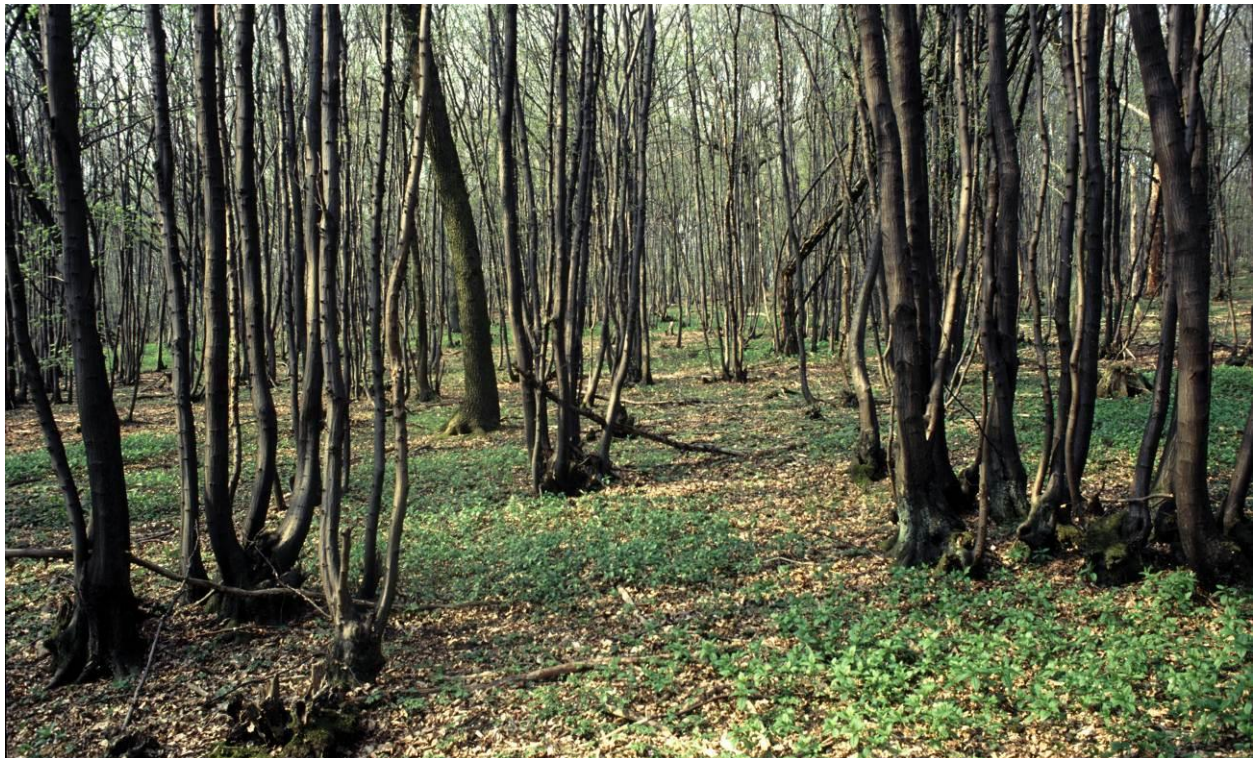
Abb. 1: Eichen-Hainbuchenwald mit gut erhaltener Mittelwaldstruktur auf mäßig trockenem Kalkstandort am Elber Berg im LK Wolfenbüttel