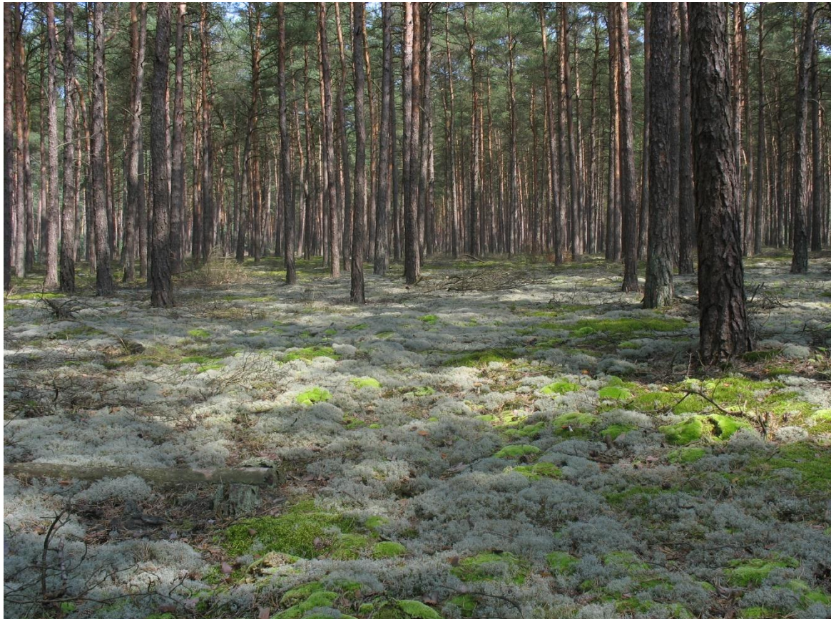
Abb. 1: Flechten-Kiefernwald bei Küsten