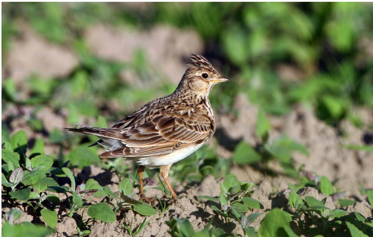
Abb. 1: Feldlerche