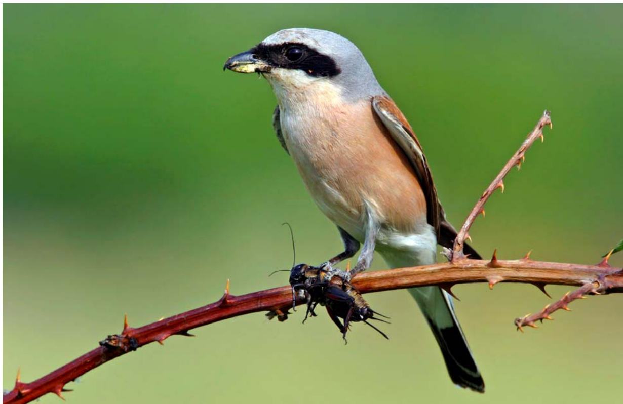
Abb. 1: Neuntöter