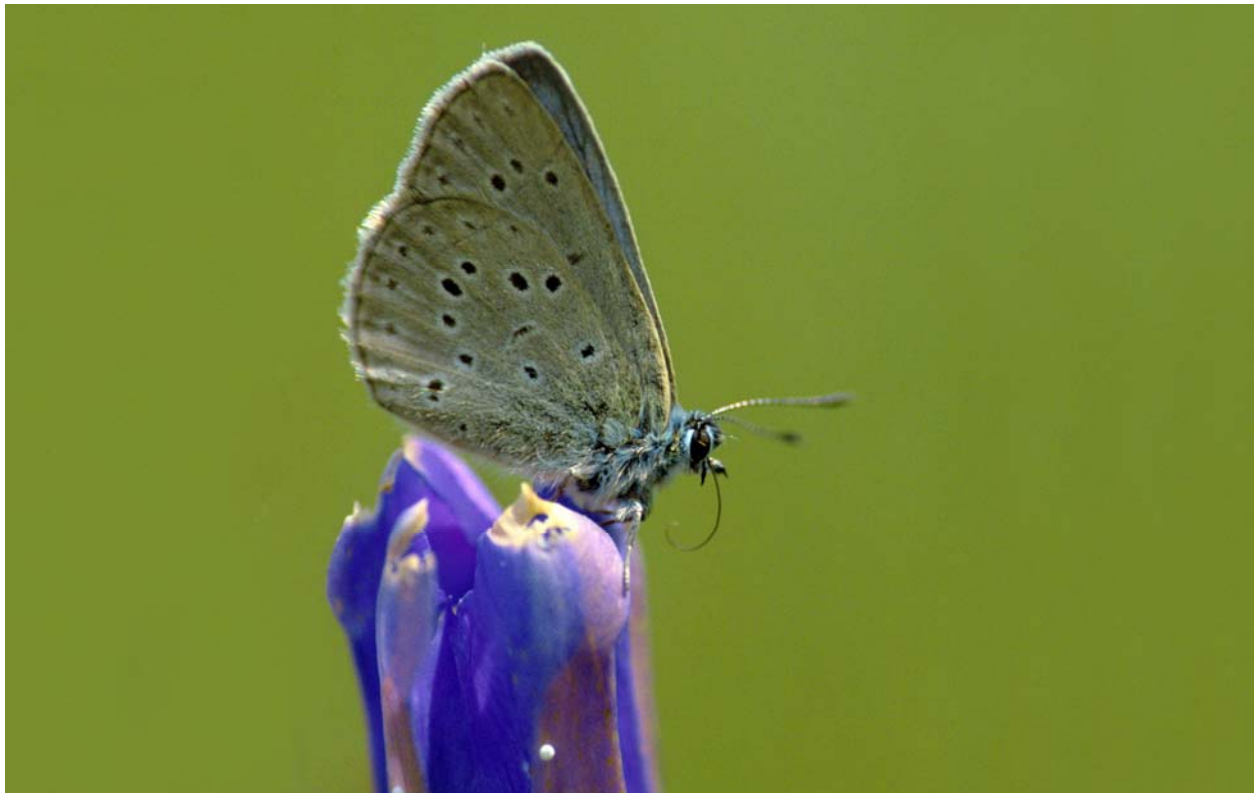
Abb. 1: Lungenenzianbläuling