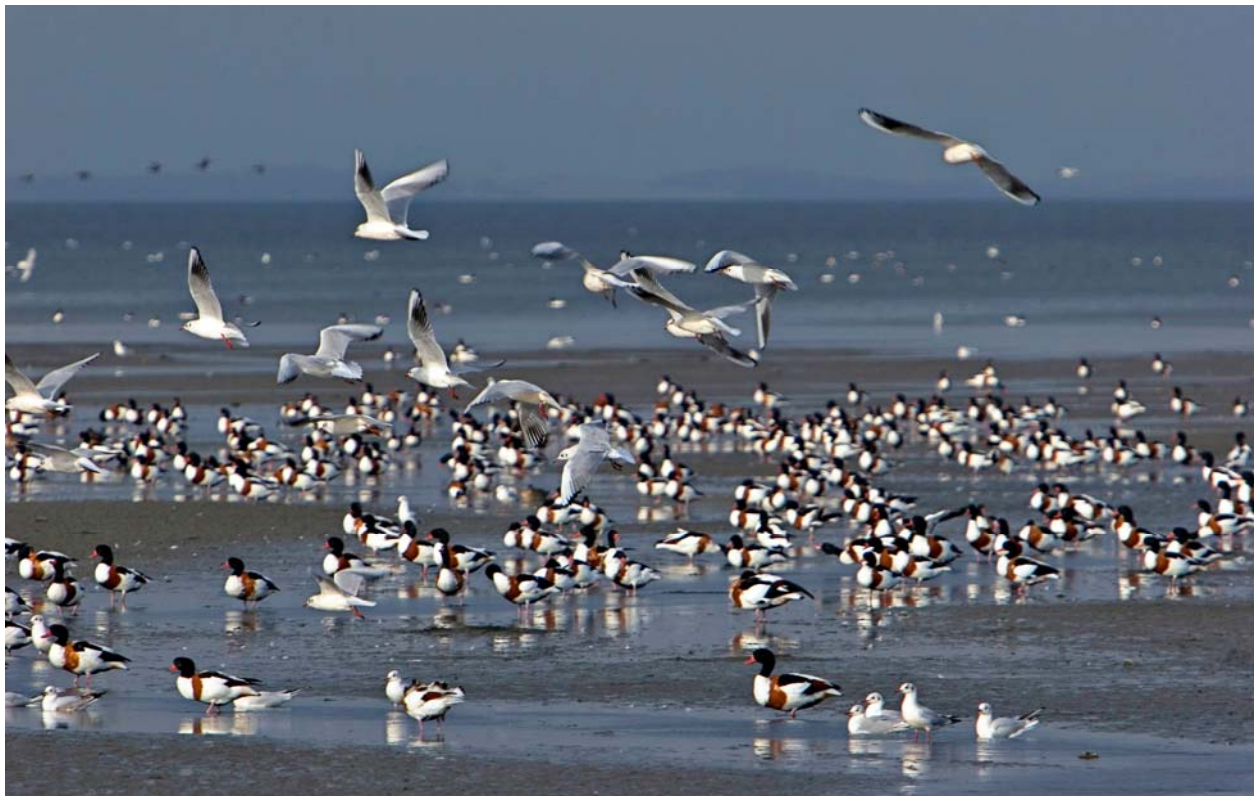
Abb. 1: Brandgänse im Wattenmeer